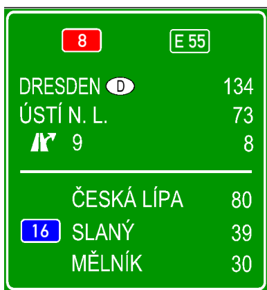
Obrázek 2: Možná nová podoba DZ IS8b na dálnici D8 za exitem 1 směr Ústí nad Labem

Vzhledem k rozdělení DZ na 2 části je možné bez ztráty přehlednosti uvést celkově více cílů, na obrázku 3 např. cíle Mělník a Slaný.